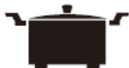
Каструля з ніжками