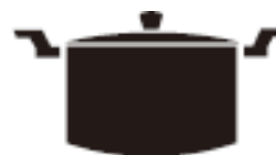
Каструля з випуклим дном