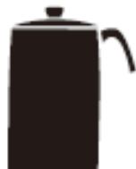
Зовнішній діаметр менше 12 см