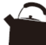
Чайник з нержавіючої сталі або емальований