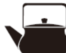
Посуд зі сплаву з низьким вмістом заліза